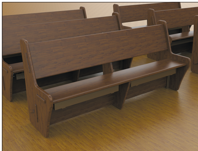
▲ Obr. 3 ● Podvěsné konvektory EXACT – Atypické řešení

Konvektory EXACT jsou vyráběny v mnoha specifických variantách, a především ve skandinávských zemích, je díky místním klimatickým podmínkám s oblibou využíván jejich topný potenciál. Dodávány jsou jako multifunkční topné lavice se samonosnou dřevěnou pohledovou deskou, jako podvěsné konvektory do církevních a veřejných prostor, jako přísně minimalistická řešení se skrytými technickými rozvody, se středovým připojením, alternativními připojovacími závity, různými typy krycích mřížek apod.