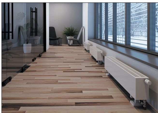
▲ Obr. 1 ● Sálavý konvektor EXACT, RAL9016