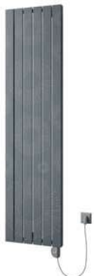
Vital Motiv Květy P35