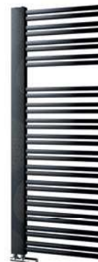
Swing Motiv Stromy P36