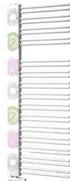
Swingo Motiv Kruhy P34