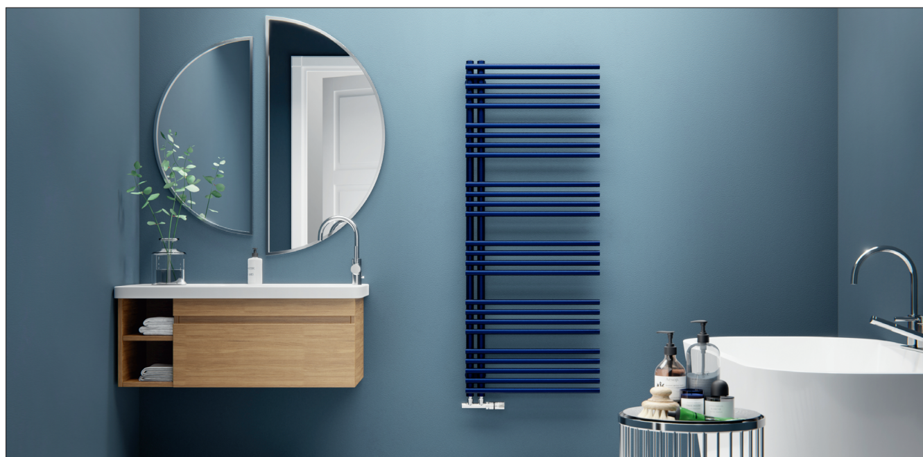
▼ Obr. 1 ● Designový radiátor Calypso, safír, struktura, [S30]